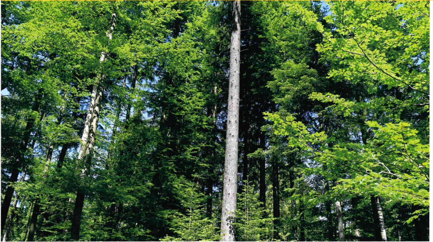
1 Ein naturnaher Mischwald wie auf dieser Gen-Tree-Untersuchungsfläche nahe Inzell leistet einen wichtigen Beitrag zur Erhaltung forstlicher Genressourcen.