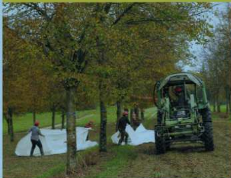
3 In Samenplantagen wird Saatgut höchster Qualität erzeugt. Samenplantagen versorgen Forstpflanzenzuchtbetriebe und Forstwirtschaft mit herkunftsgerechtem Saatgut.